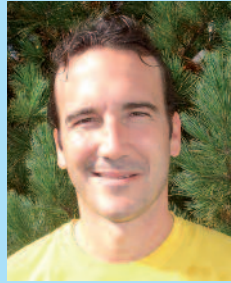
Igor Ogris Ex-Profifußballer